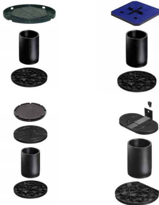
Figuur 11: DNS-nivelleringsysteem met comfixschaal (Dreentegel®-systeem) / vlakke oplegschijf (Drenoliet®-systeem)

Het systeem bestaat uit een kunststof drukverdeelvoet (met diameter 200 mm), waarop een polyethyleen buis van variabele lengte (tot 40 cm) wordt bevestigd. Bovenop deze buis wordt ofwel een comfixschaal of een vlakke oplegschijf of een randplateau (met haakse opstand) geplaatst. De comfixschaal en de oplegschijf hebben aan de onderkant een profilering welke aansluit op de PE-buis.