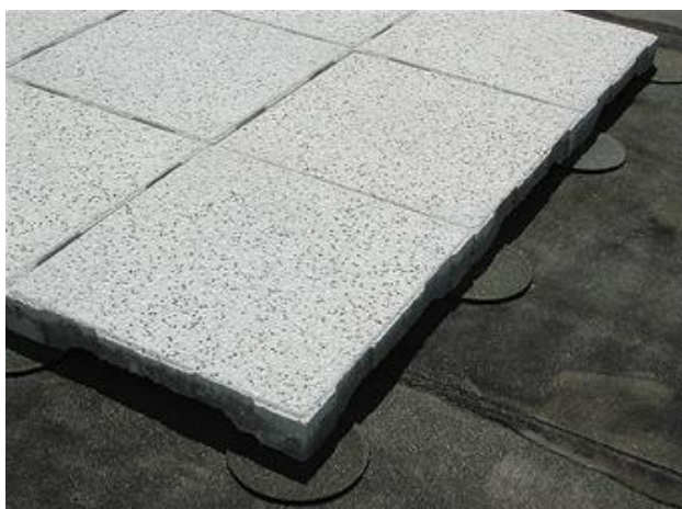
Figuur 13: voorbeeld van Dreentegel®-systeem op bitumineus warmdak