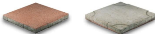
Figuur 6b: Drenoliet®-tegels (voor plaatsing op lockplate ring)