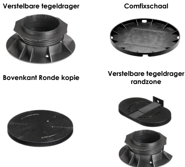
Figuur 9: regelbare tegeldrager

De comfixschaal en oplegschijf hebben aan de onderzijde een profilering die aansluit op de regelbare voet (zie figuur 10).