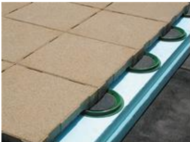
Figuur 12: voorbeeld van Dreentegel®-systeem op omkeerdak