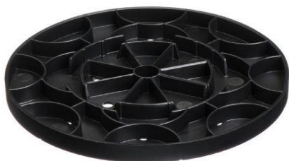
Figuur 10: Profilering onderzijde comfixschaal / oplegschijf (combinatie regelbare tegeldrager)

De comfixschaal en oplegschijf hebben aan de onderzijde een profilering die aansluit op de regelbare voet (zie figuur 10).