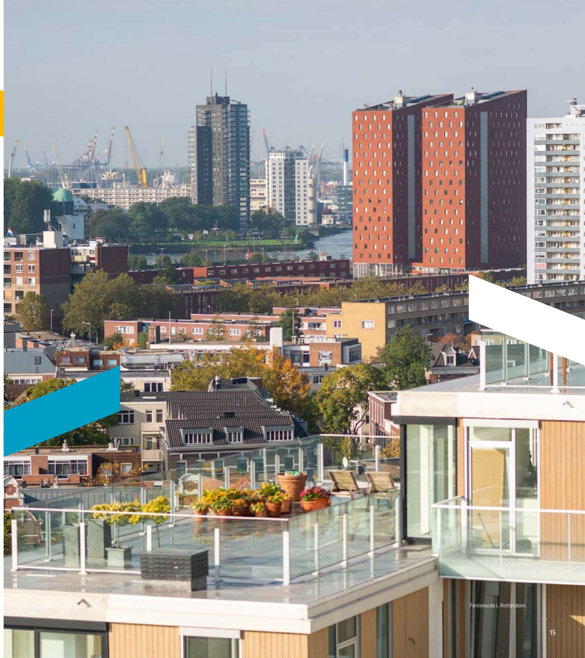
Fenixloods I, Rotterdam.

De mogelijkheden daarboven zijn dus eindeloos. Soms zijn we de belangrijkste partij, soms spelen we een bijrol. Afhankelijk van wat er op dat dak gaat gebeuren. Of het nu gaat om duurzame daken, met perfect geregeld waterafvoer. Daken die uiteindelijk gaan dienen als stadstuin of ecologische broedplaats. Daken die zonne-energie opwekken. Of sociale, leefbare daken. In al deze gevallen zijn wij de partij voor dakbestrating. Zoontjens is de toegangspoort tot een wereld die letterlijk en figuurlijk van een ander niveau is. Want alles dat op de grond kan, moet ook op dat prachtige onontgonnen gebied boven ons kunnen. We dragen ons hart hoog. En geloven in higher grounds.