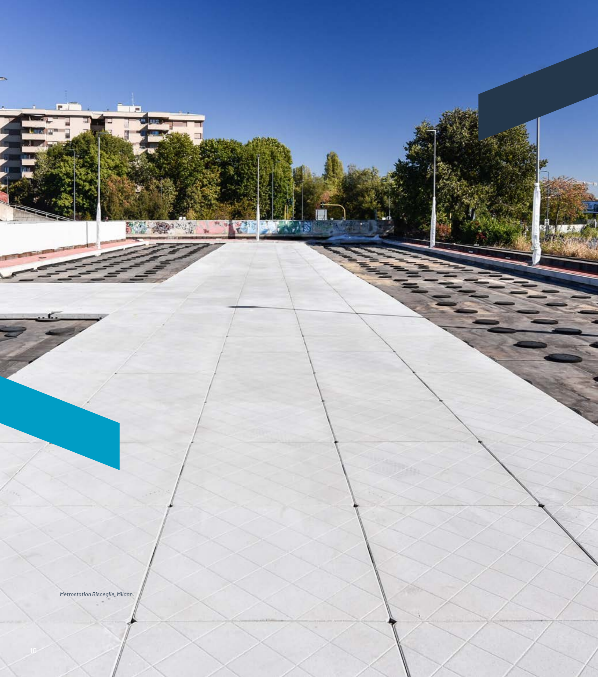
Metrostation Bisceglie, Milaan.